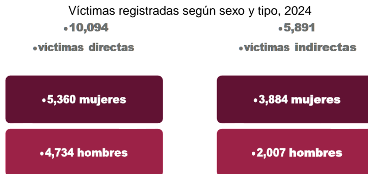
Figura 1. Elaborada por la Comisión Ejecutiva de Atención a Víctimas, con información proporcionada por la Dirección General del Registro Nacional de Atención a Víctimas (RENAVI).

En el año 2024, se recibieron 23 mil 658 solicitudes para la inscripción al RENAVI, de las cuales 3 mil 324 corresponden al ámbito federal y 20 mil 334 al local. La CEAV inscribió a 15 mil 985 personas en situación de víctima, de las cuales 9 mil 244 son mujeres y 6 mil 741 hombres.