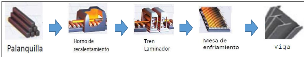
Diagrama del proceso de producción de vigas de acero