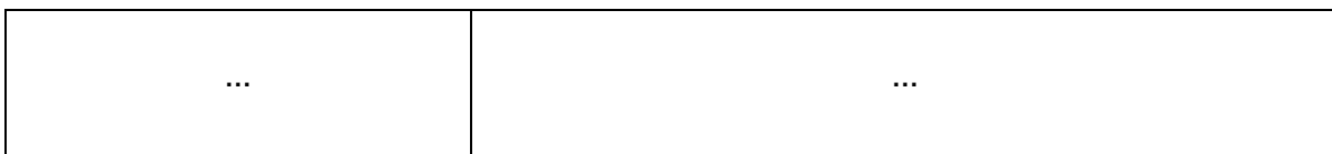
Figura 2.- Muestra gráfica de uso del Sello IFT, las siglas “IFT” en mayúsculas y el número de Certificado de Homologación, en el marcado o etiquetado físico y/o electrónico de Productos homologados.

Sexto.- En el marcado o etiquetado físico y/o electrónico de los Productos homologados, se deberá incluir el Sello IFT, además del prefijo "IFT" en mayúsculas y el número de Certificado de Homologación previstos en el lineamiento Trigésimo octavo de los Lineamientos de Homologación, tal como se muestra en la figura 2.