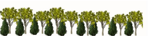
Figura 4. Monocultivo con sombra especializada