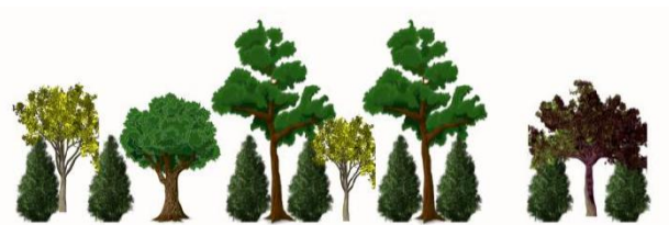
Figura 3. Policultivo comercial bajo sombra