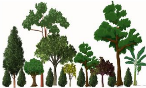
Figura 1. Sistema rusticano

Con base en las siguientes características, señale el tipo de cafetal que se encuentra en el predio objeto de la solicitud de autorización de la Marca de Certificación.