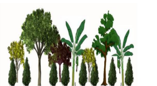
Figura 2. Policultivo diverso o tradicional