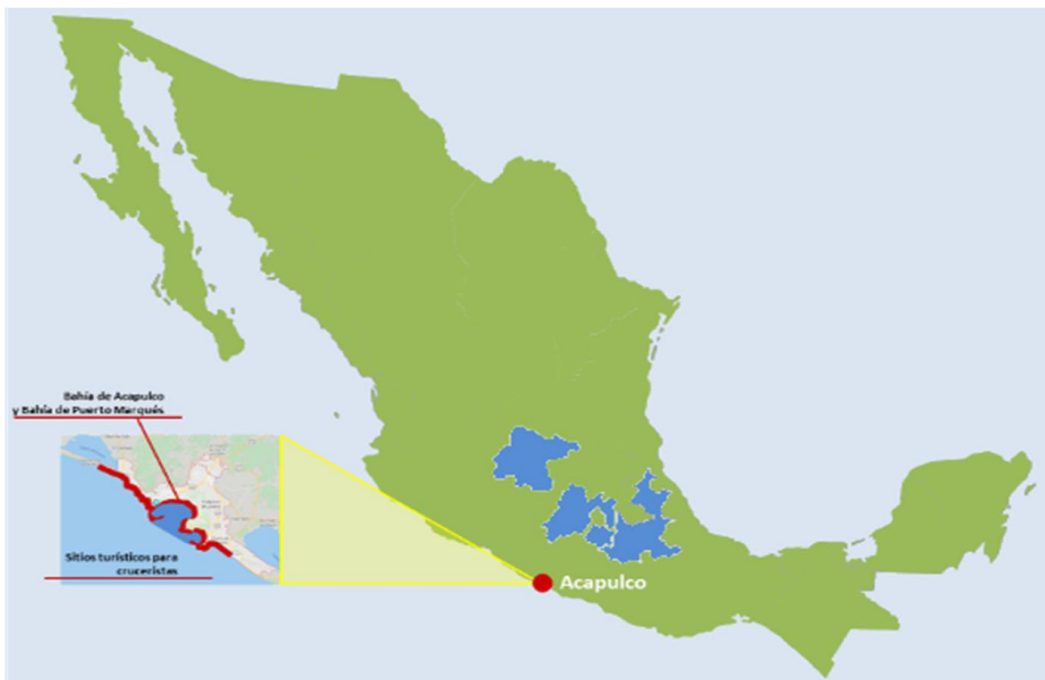
Figura 2. Hinterland geográfico del Puerto de Acapulco

Hinterland geográfico: integrado por los estados de Morelos y Puebla que son el origen de los vehículos de exportación; en menor medida, Estado de México y Guanajuato.