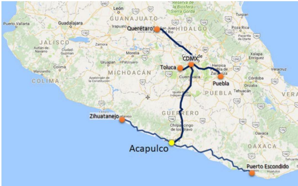
Figura 3. Principales enlaces carreteros entre el Puerto de Acapulco y su área de influencia.