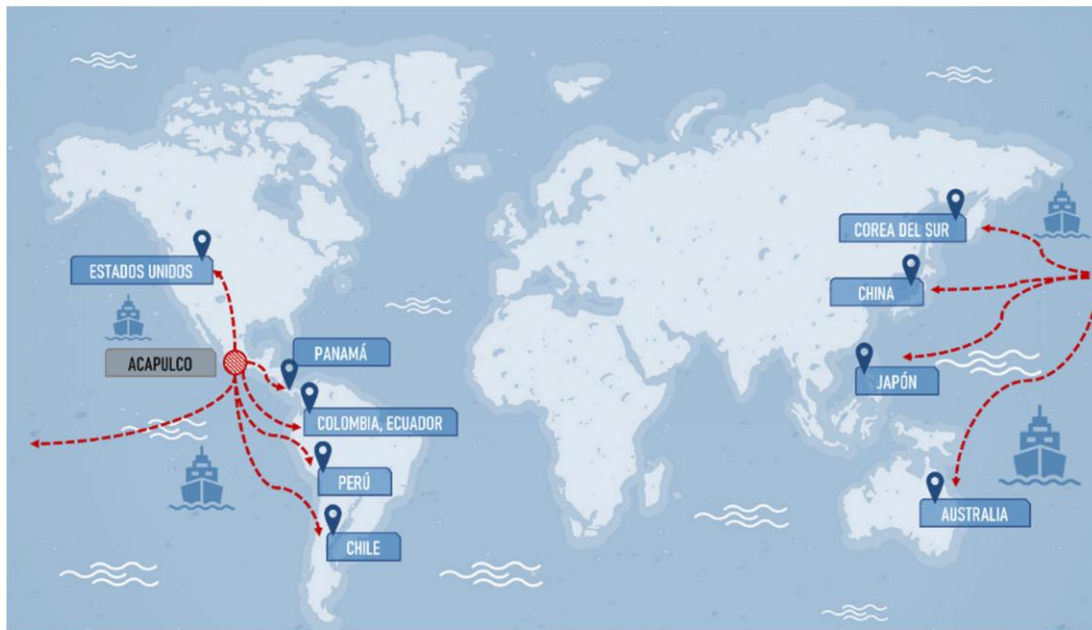
Figura 5. Foreland del Puerto de Acapulco (mercado de automóviles)