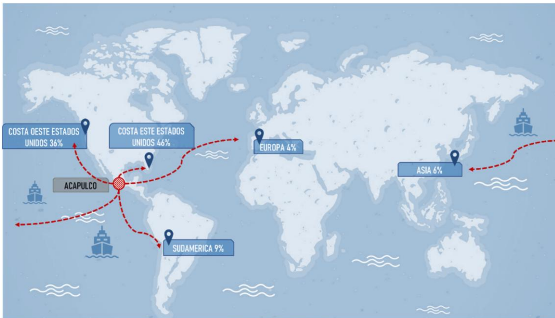
Figura 4. Foreland del Puerto de Acapulco (mercado de cruceros)