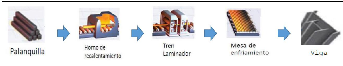
Diagrama del proceso de producción de vigas de acero