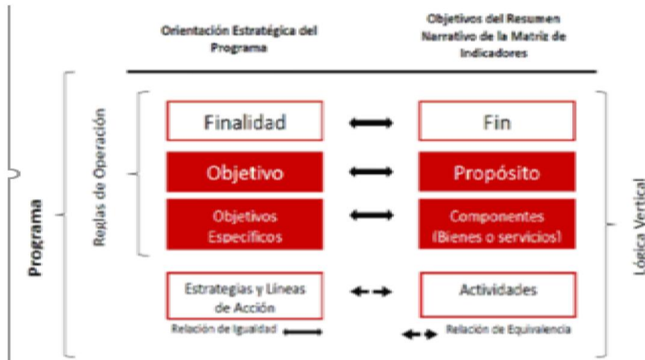
Relación Lógica entre la Orientación Estratégica y el Resumen Narrativo de la Matriz de Indicadores para Resultados

El monitoreo y evaluación de resultados del Programa se realizará a través de 12 indicadores, que se encuentran vinculados al mismo. En cada uno de los indicadores planteados se describe: el nombre, la fórmula de cálculo y la periodicidad con la que se obtendrán los resultados de la operación.